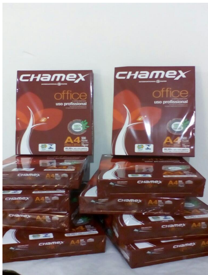
Papel Sulfite A4