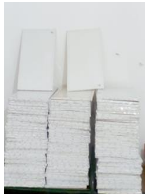
Tela Para Pintura