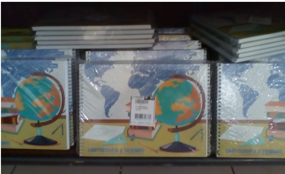
Caderno de Desenho