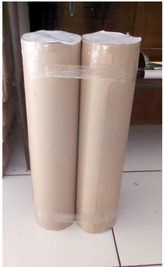
Bobina de Papel Kraft