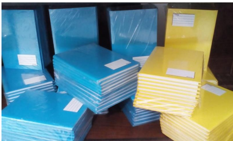
Caderno de Capa Dura