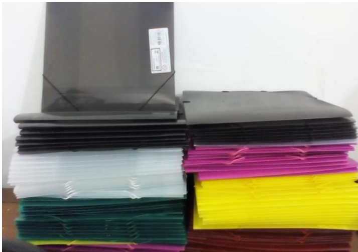
Pasta Plástica 4cm