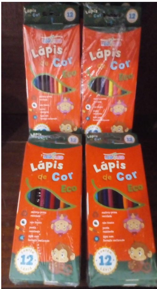
Lápis de Cor