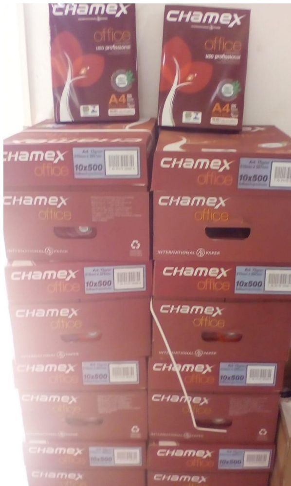
Papel Sulfite A4