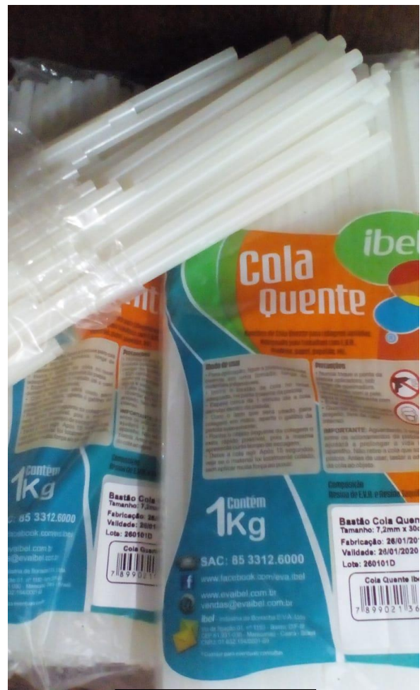
Refil Cola Quente